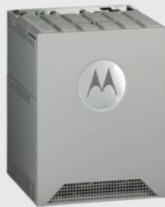
SISTEMA DIMETRA EXPRESS MTS2 TETRA