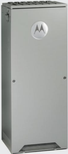
SISTEMA DIMETRA EXPRESS MTS4 TETRA